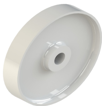
RLR - ROLETE DE RETORNO LISO.

O Rolete de retorno (RLR/RLB), é utilizado no leito de retorno das esteiras. Serve para qualquer modelo de esteira, sua função é deslizar e manter a esteira alinhada em seu retorno, quando a aplicação necessitar a utilização de taliscas, deve-se respeitar a altura entre o diâmetro externo do eixo de retorno da esteira e o diâmetro externo do rolete (RLR/RLB), este elemento pode ser aplicado no eixo de retorno de esteiras leves e de pequenos passos.